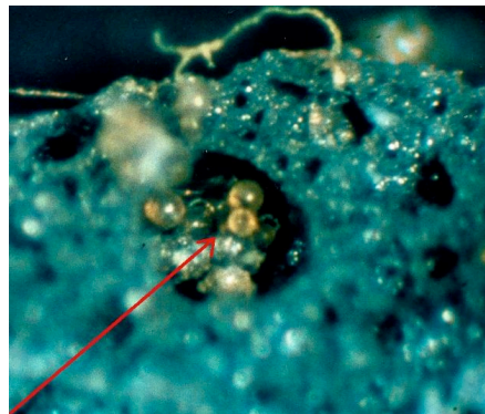
sporen beschermd in porie van kleikorrel

Mycorrhiza 's zijn ook in Nederland verkrijgbaar, sinds kort ook voor de hobbytuinier. De voor rozen geschikte preparaten bevatten een cocktail van een aantal verschillende soorten, meestal van het geslacht Glomus . Bij de selectie van deze schimmels spelen criteria zoals een snelle en intensieve wortelkolonisatie, een beperkte specialisatie m.b.t. de waardplant, een hoge biologische activiteit en aanpassingsvermogen aan verschillende groeiomstandigheden de belangrijkste rol. De meeste commerciële producten bevatten de sporen van Mycorrhiza 's, veelal op en vaste drager, die de sporen bescherming biedt. Sporen houden hun volle kiemkracht voor 1 tot 2 jaar mits koel, droog en donker bewaard.