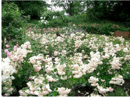
Het rosarium van Wittington Estate

len zijn echter kostbaar en tijdrovend en moeilijk toepasbaar in een bestaand rozenperk. Een alternatief is de behandeling van de nieuwe aanplant met Mycorrhiza 's.