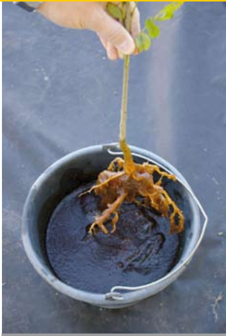
Het aanbrengen van sporen en levende schimmeldraden (mycelien) door worteldip rond de kale boomwortels voor de aanplant zorgt voor snelle symbiose van de fijne wortels.

bepaalde soorten 'kwekerijschimmels' aanwezig, die zich hebben aangepast aan een hogere bemesting. In de nieuwe situatie waarin de boom terecht komt, is de grond meestal schraler en omgewoeld en heeft niets meer te maken met een natuurlijke bodem waarin veel verschillende mycorrhizasoorten voorkomen.