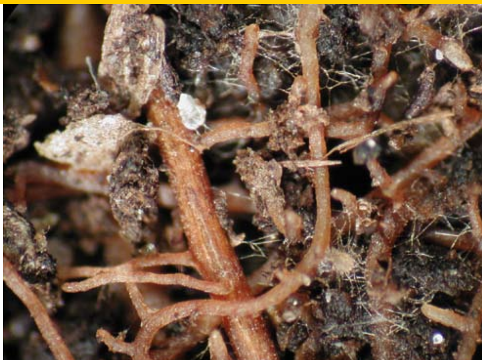
Wortel met hyfen