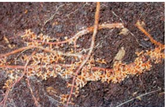
Ectomycorrhizaschimmels ommantelen de worteltopjes van de boomwortel en veranderen daardoor hun vorm. Op deze foto de schimmelsoort van veraf.

Op boomwortels zitten de ectomycorrhizaschimmels aan de worteltopjes, die ze met een dicht vlechtwerk van draden ommantelen. De worteltopjes veranderen daardoor van vorm. De uit de wortels groeiende schimmeldraden kun je met het blote oog nog zien en kunnen metersver groeien en verschillende bomen met elkaar verbinden. Deze mycorrhizasoort zorgt ervoor dat oudere bomen voedingsstoffen geven aan jonge boompjes als ze in de schaduw van deze oude bomen staan. Een boom kan veel verschillende soorten ectomycorrhizaschimmels rond zijn wortels herbergen.