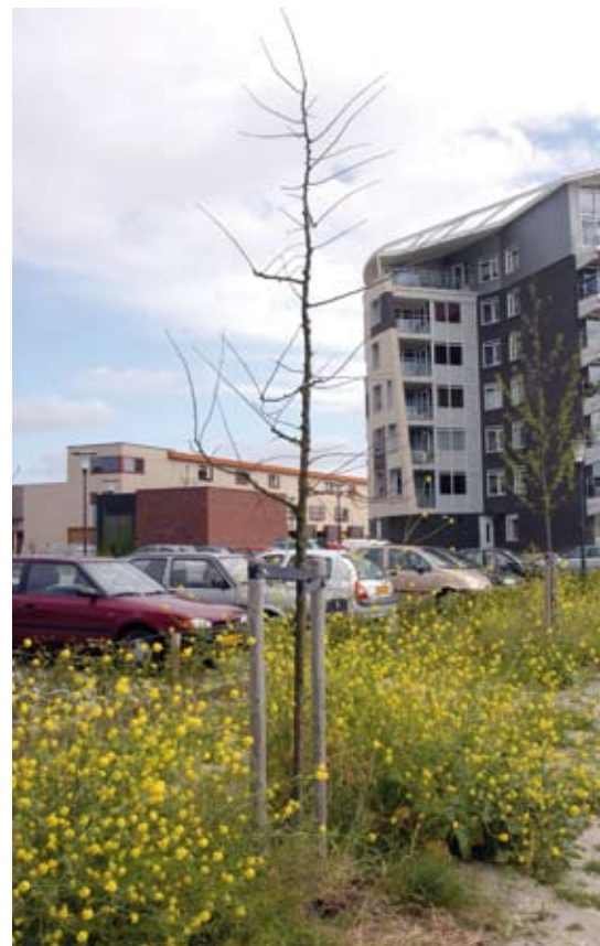
Bij de stelling, dat 'alle grote bomen in Nederland tot wasdom gekomen zijn zonder toevoeging van tmycorrhizaschimmels' wordt vergeten hoeveel geplante boompjes het in de laatste honderd jaar niet hebben gehaald.

en beschadigen. Aantasting door bijvoorbeeld Verticillium is dan ook een logisch gevolg.